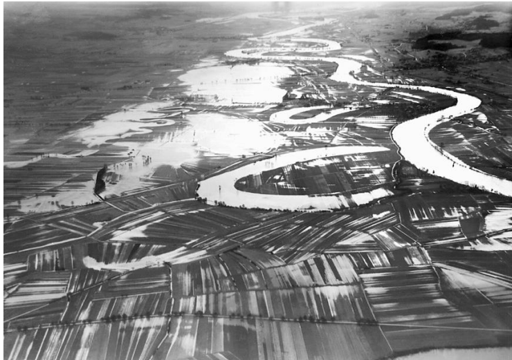
Hochwasser 1944, Büren