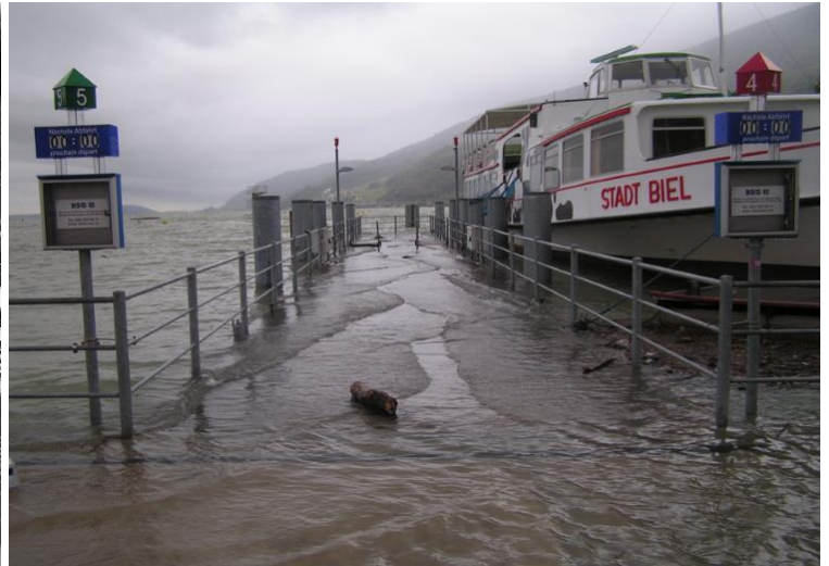
Hochwasser 21.9.2007; Hafen Biel

Die Dimensionen und die Bedeutung der Juragewässerkorrektion.